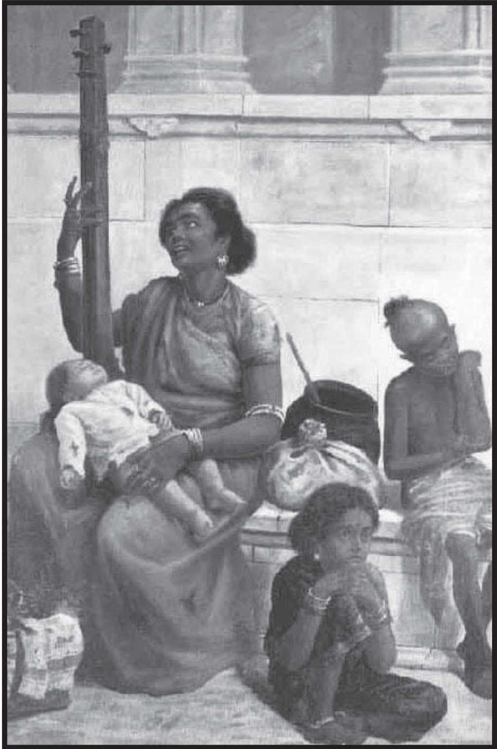
ഈ ചിത്രത്തെക്കുറിച്ച് ഒരു കുറിപ്പെഴുതുക.